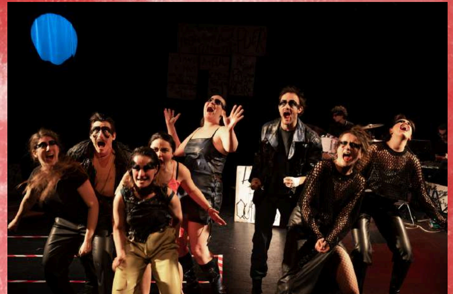
L'opéra de 4'sous – 2023 Au Théâtre de L'épée de Bois