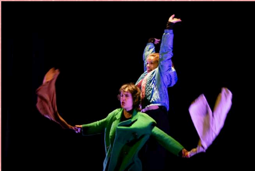
Vestiaire – 2024 Au Théâtre du Troisième Type

Pinocchio, de rêve et de bois est le quatrième spectacle de la compagnie.