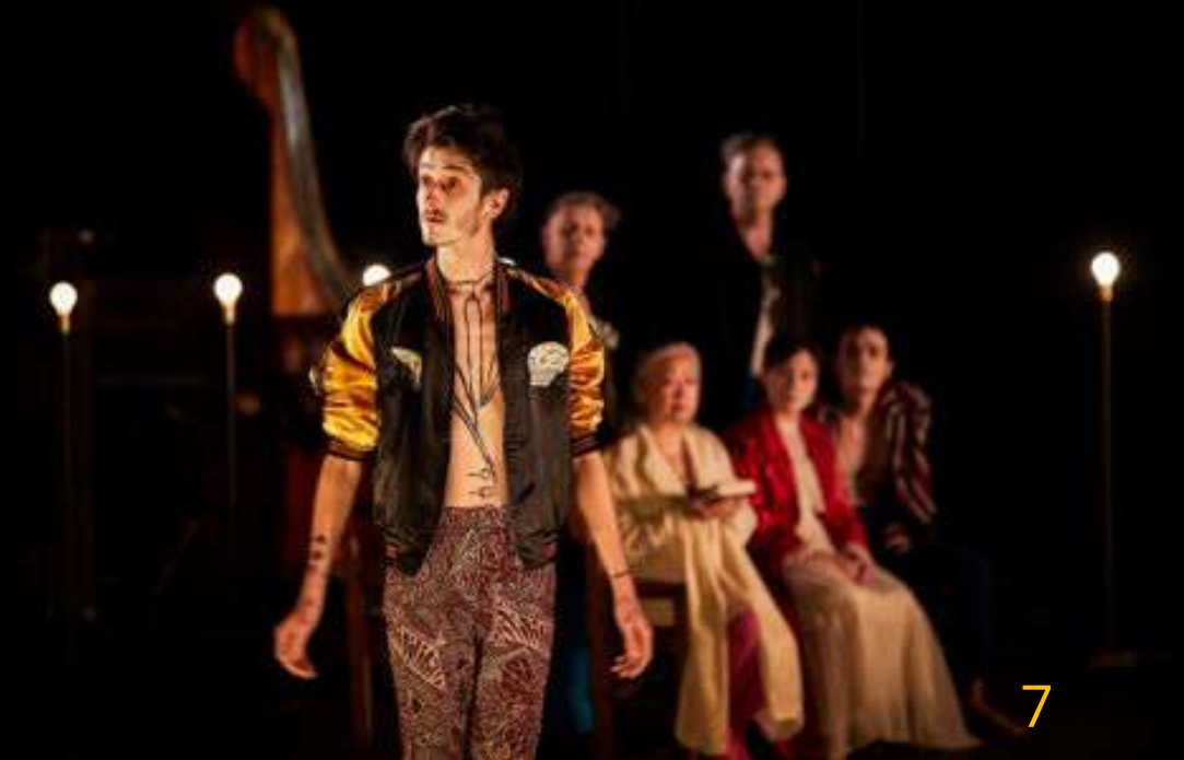
Le jeu des ombres de Jean Belorini – 2020