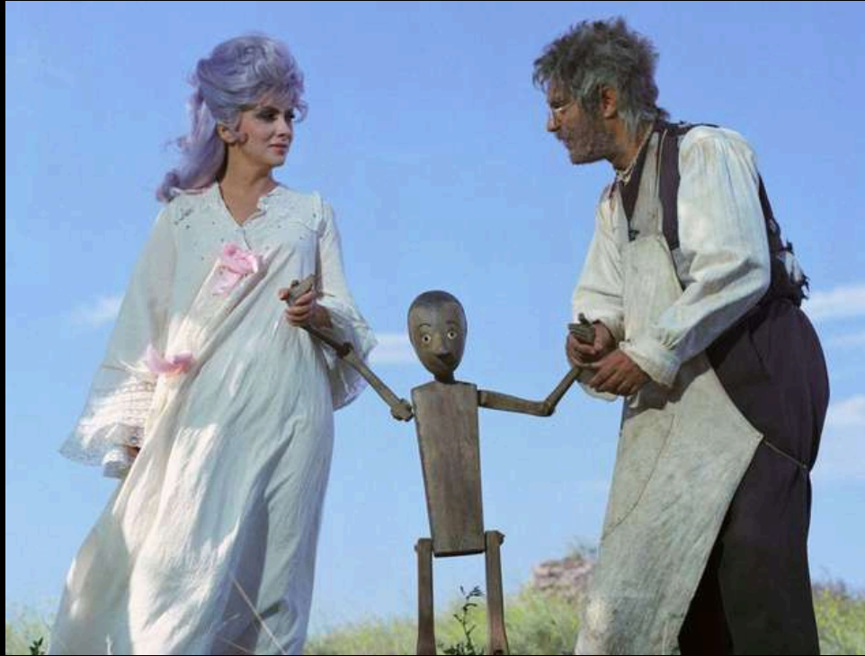
Les aventures de Pinocchio de Comencini – 1972