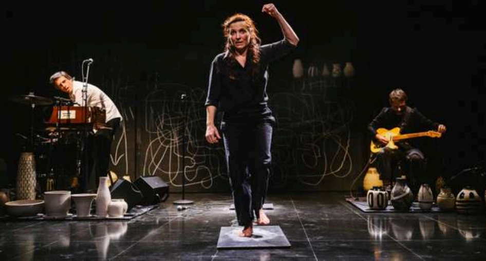
La Cachette de la Cie Baro D'Evel – 2024