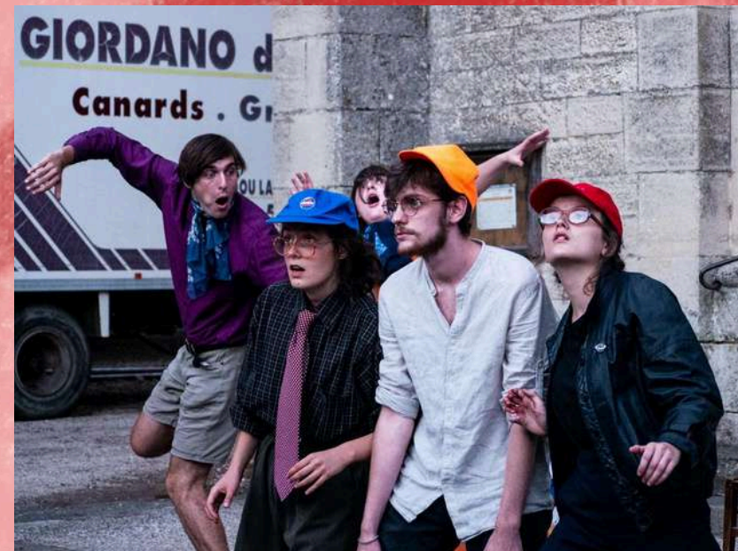
La Nova – 2020 Dans la rue à Saint Martin Labouval (Lot)