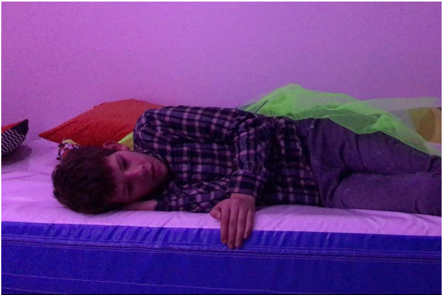
LA JOIE DE VIVRE D'APRES LA JOIE DE VIVRE ©Antoine de Foucauld