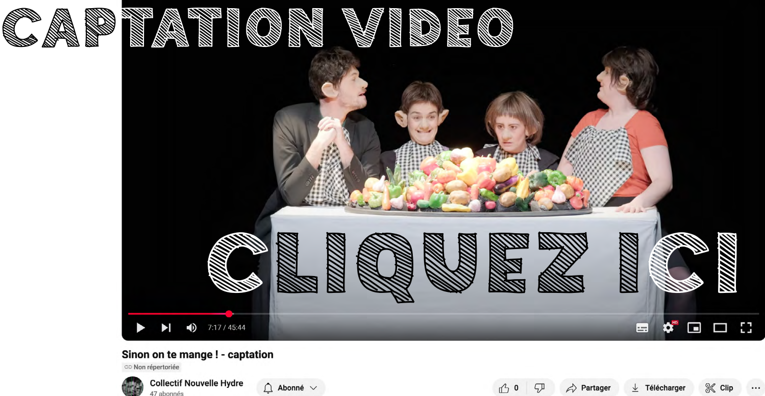
Captation réalisée le 14 janvier 2025 au théâtre de Saint-Lô par Alban Van Wassenhove