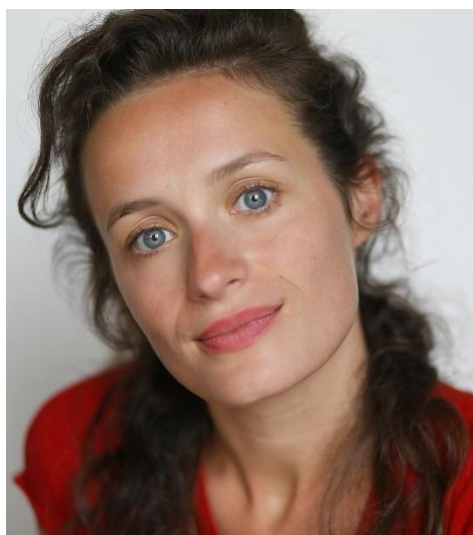
La Petite Sirène, auteure et metteuse en scène