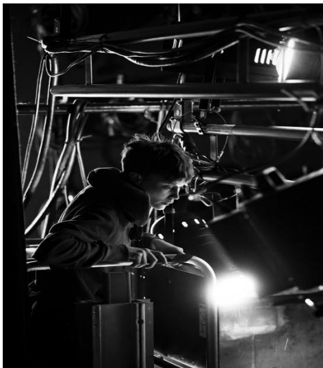
Créatrice lumière, créatrice de marionnette