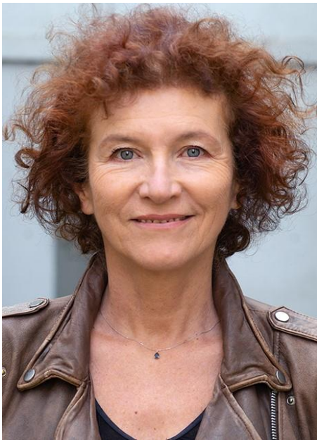
La Reine, la sorcière des Abysses